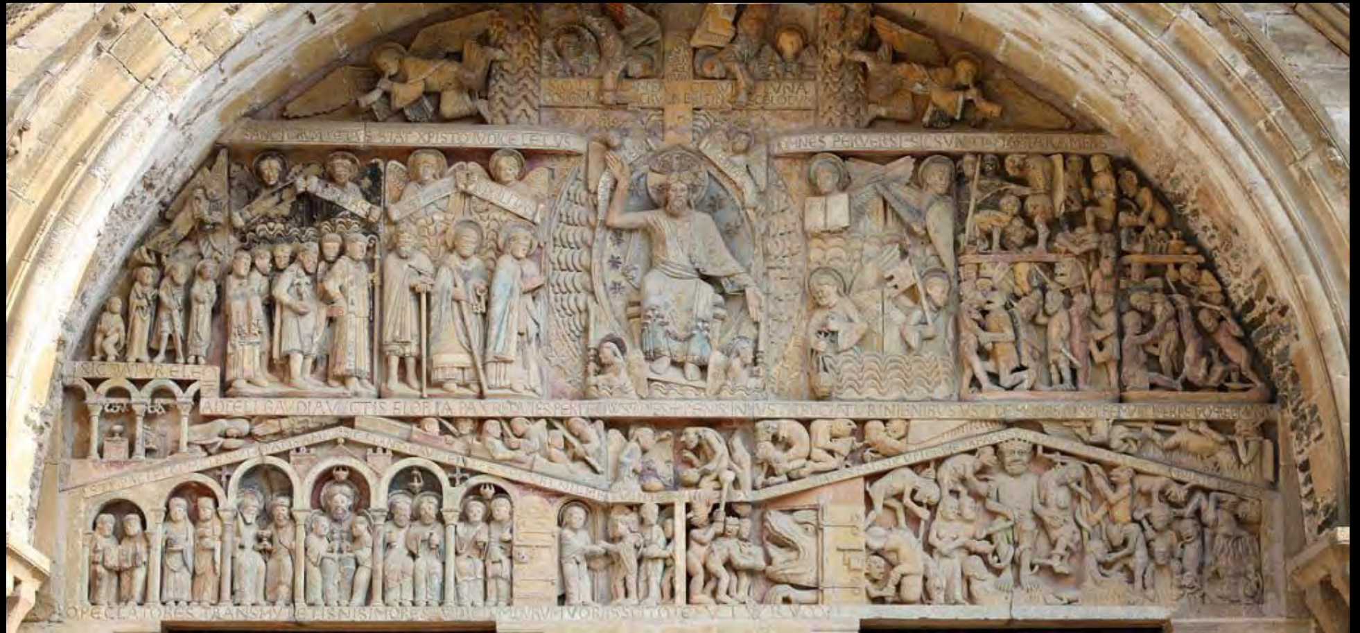
Basilica di Conques (Francia)