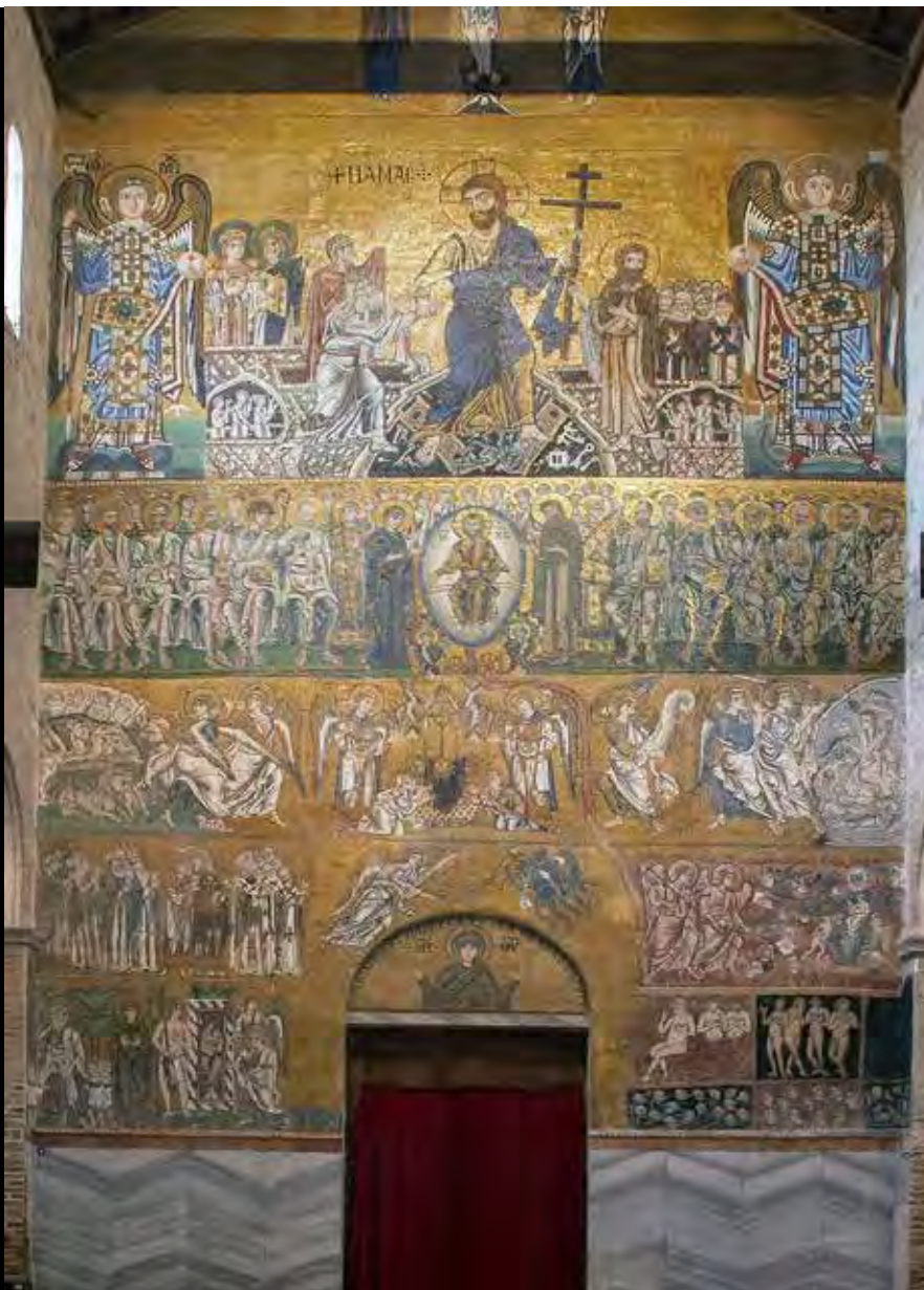
Basilica S. Maria Assunta (Torcello)